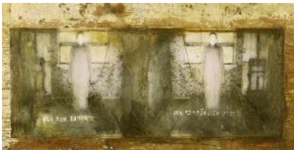
The one who fell asleep and the one that stayed awake

Gryningsbrisen har hemligheter att anförtro dig.