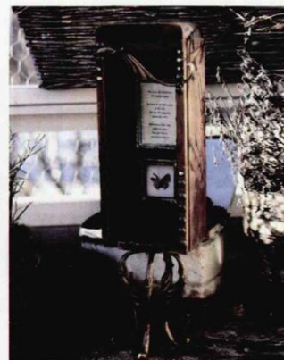
Ása Boström, Ukryt , 2012, asambláž, 40 x 11 x 9 cm