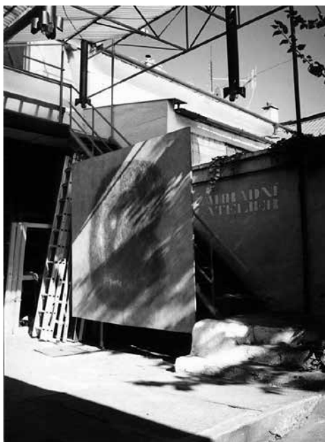
Zahradní ateliér.