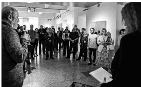
Vernisáž výstavy EQUILIBRIUM – Hledání rovnováhy – Slezskoostravská galerie Ostrava.