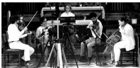
Our Young Orchestra (San Marino).

Our Young Orchestra je projekt studentů konzervatoře Bruno Maderny v italské Ceseně. Jsou do něho zapojeni hudebníci z několika zemí, ze San Marina, Ruska, Japonska a Itálie. Poprvé se tento orchestr představil v roce 2021 v bazilice San Domenico v Ceseně s barokním repertoárem. Letos jeho členové do Kroměříže na Forfest přijeli výhradně se soudobou hudbou.