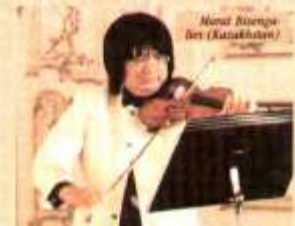
Monat Bismarck (Kazachstán)