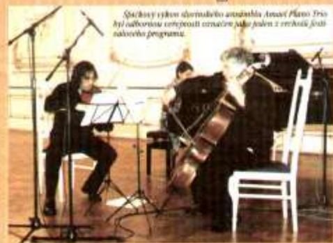
Společný výkon čtyřmístného ansámblu Anand Piano Trio byl odlišnou interpretací umělců jako jeden z vrcholů jejího programu.