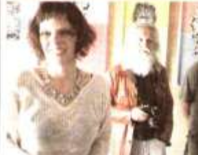
Vernost rytmy národního folklorního festivalu v Kroměříži Galerii C. Arha