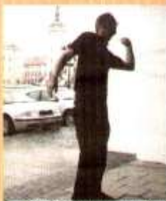
Performance dvou již významného amerického autora Lewis Ginzona (USA) zaplnou myšlenky pro diváky i ty bar vyřezané

Kroměříž (mih) – Na mezinárodním festivalu současného umění s duchovním zaměřením Forfest zazněly poslední tony a dvacátý ročník se stal historií. Na jeho slavnostní zahájení vyjádřila místostarostka J. Čihalová jednu velkou naději: „V současné době řeší hudební festivaly v Kroměříži určité problémy, protože i jejich fungování samozřejmě závisí na penězích. Budeme opravdu rádi, když tradice hudby a hudebních festivalů ve městě zůstane a když se jejich počet nebude zmenšovat.“